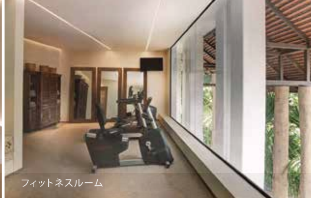
フィットネスルーム